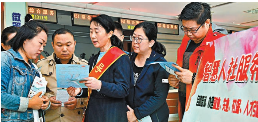
■ 人力資源和社會保障部副部長游鈞在昨日舉行的國新辦政策吹風會上表示，有信心保證養老保險基金長期按時足額發放。圖為山東省青島市的一個人力資源和社會保障服務中心。

降低社保費率，減輕了企業的負擔，但作為中國社會保障體系的重要組成部分，社保費率的降低也會引發民眾對於社保體系可持續發展，特別是未來養老金能否足額發放的疑問。對此，游鈞表示，今年上半年，社保基金運行總體平穩，能夠確保各項社保待遇按時足額發放。