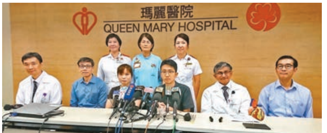
許先生(前排右三)與太太(前排左三)形容兒子有機會換心是奇蹟。