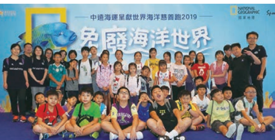
題為「免廢海洋世界」的頭炮宣傳活動，吸引眾多大小朋友參與。

該活動獲中國遠洋海運集團有限公司冠名贊助。中遠由2014年至今，一直與香港一家非牟利註冊慈善機構合作，贊助新來港或低收入家庭的兒童參加綠色生活體驗同樂日、昂坪文化導賞保育同樂日、米埔自然