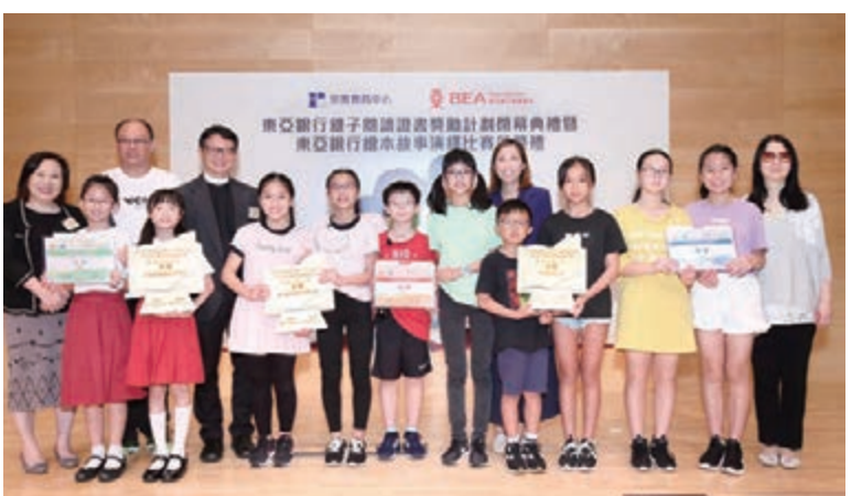
超過80名計劃參加者於閉幕典禮中獲頒獎項。

於2018-2019年度，共有2,400名來自領取綜合社會保障援助家庭的學童參與該計劃。參加者除可獲得4至