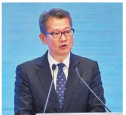
陳茂波稱未見有資金大舉流出本港。

和5月出口貨值下跌2.6%，與第一季相若，而且同時也影響消費意慾，4月至5月的本地消費跌幅擴大至3.3%，跌幅高於首季的逾1%。陳茂波續稱，6月訪港旅客增長約8.5%，增幅低於首5個月平均的15%。隨着中美同意重啟貿易談判，他認為國際經濟緊張氣氛有所緩和，但談判仍存在不確定因素，加上面對地緣政治局勢，下半年環球經濟有很多變數，下行風險大。