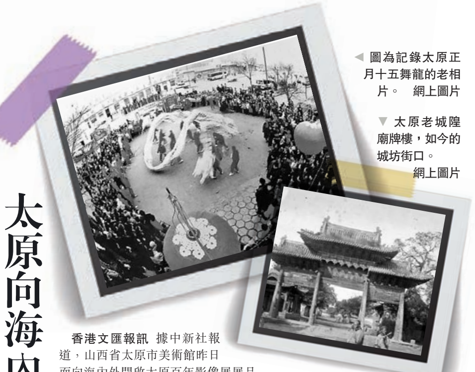
圖為記錄太原正月十五舞龍的老照片。

香港文匯報訊 據新華社報道,昨日,滇金絲猴全境保護網絡在雲南省香格里拉市建立。該機構由雲南省林業和草原局聯合多家公益組織、科研和民間機構推動建立,為保護世界瀕危物種滇金絲猴而開展相關工作。滇金絲猴是中國獨有的珍稀瀕危物種,僅分佈於金沙江和瀾滄江間面積約2萬平方公里的狹窄地帶,種群數量約3,000隻,被列為國家一級重點保護動物,也是世界自然保護聯盟(IUCN)紅色名錄中的瀕危物種,是世界上海拔分佈最高的靈長類動物,與大熊貓一樣被稱為中國的「國寶」。滇金絲猴全境保護網絡為雲南首次嘗試建立多方參與的聯合保護機制。雲南省林業和草原局副局長王衛斌介紹,雲南省相繼建立了四處保護地以保護滇金絲猴及其棲息地,總面積達47.8萬公頃,基本覆蓋了滇金絲猴種群集中分佈區域,此外又將保護地外990.66公頃的滇金絲猴棲息地納入保護範圍,為滇金絲猴種群恢復和壯大創造了良好條件。