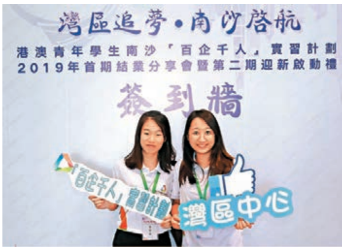
■昨日南沙「百企千人」實習計劃今年首期結業分享會暨第二期迎新啟動禮在廣州舉辦。

香港文匯報訊(記者 胡若璋 廣州報道) 昨日,港澳青年學生南沙「百企千人」實習計劃2019年首期結業分享會暨第二期迎新啟動禮在廣州南沙遊艇會舉辦。第二期413名港澳青年學生正式開啟大灣區快線南沙一個月的實習體驗。