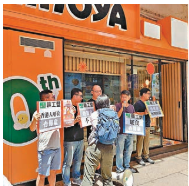
▶職工盟到吉野家一分店門外抗議，稱要拒絕「職場政治打壓」。

香港吉野家日前在廣告中借「獅子狗」諧音，侮辱清理涉嫌侵犯個別警員私隱標貼的警員是「撕紙狗」。擁有吉野家香港經營權的合興集團有限公司總裁洪明基日前表示，在知悉事件後表示極爲憤怒，已和涉事的外判廣告公司解約，並解僱負責廣告事務的公司員工。