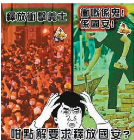
有網民製惡搞圖,揶揄反對派精神分裂。

受外媒採訪時,在鏡頭前辱罵警方在立法會內防守、防止示威者衝進來的行為「荒謬」。有人就製作另一張圖片,一邊是反對派要求「釋放衝擊『義士』」,另一邊是反對派指責「衝嘅係鬼!係『國安』!」,質問反對派:「咁咁解要求釋放國安?」 ■香港文匯報記者 甘瑜