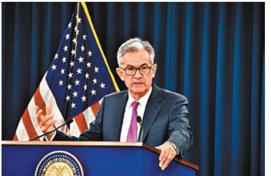
市場關注焦點轉移至美國聯儲備理事會(FED)主席鮑威爾周三及周四發表的國會證詞，以及本周稍晚公佈的美國通脹數據。資料圖片

歐元兌美元走勢，在上週五的挫跌後，周一歐元勉強守在1.12關口上方，當前要留意6月中旬低位1.1179，若後市跌破此區，將會形成一組雙頂形態，或會迎來更猛烈的下挫，下方較大支持預估為在4月及5月多次守穩的1.11水平，關鍵指回1.10關口。至於阻力則回看25天平均線1.1290，重要阻力在250天平均線1.1385，歐元於6月底多次上探此區均無功而返。