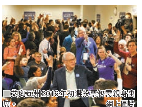
艾奧瓦州2016年初選投票仍舊親身出席。