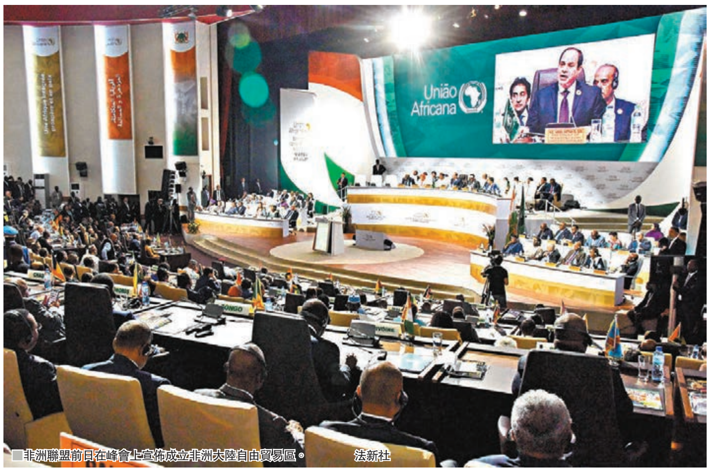
非洲聯盟前日在峰會上宣佈成立非洲大陸自由貿易區。