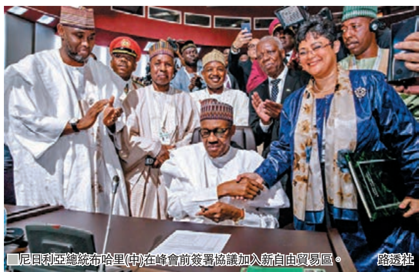
尼日利亞總統布哈里(中)在峰會前簽署協議加入新自由貿易區。