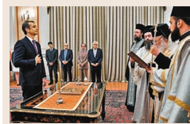
米佐塔基斯(左)昨日宣誓就任總理。

賀文萍表示，非洲單一市場將顯著降低亞歐商品進入非洲的成本，促進這些地區與非洲的貿易，且自貿區成立後，營商環境有望改善，亦可吸引外企赴非洲投資。其中中國已連續多年穩居非洲第一大貿易夥伴，去年中非貿易額達2,042億美元(約1.59萬億港元)，預料當非洲大陸自貿區成立，市場潛力逐漸釋放，中非經貿合作也將更為深入。