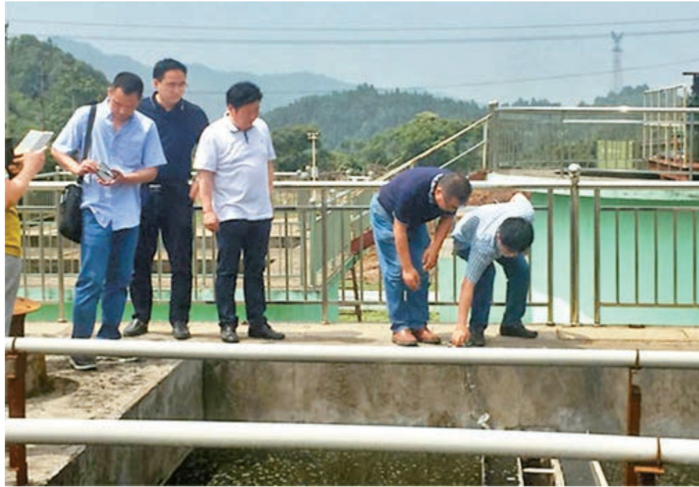
■第二輪第一批中央生態環境保護督察將全面啟動，並首次對中央企業開展督察進駐。圖為督察組早前在江西省上饒市檢查垃圾填埋場處理設備。資料圖片

香港文匯報訊 (記者 葛沖 北京報道) 內地新一輪生態環保督察「風暴」即將拉開大幕。生態環保部8日對外發佈消息稱，第二輪第一批中央生態環境保護督察將於近期全面啟動。目前，生態環保部已組建8個中央生態環境保護督察組，分別對上海、福建、海南、重慶、甘肅、青海等6個省(市)和中國五礦集團有限公司、中國化工集團有限公司2家中央企業開展督察。這是中央生態環保督察組首次對中央企業開展督察進駐。進駐時間約為1個月。