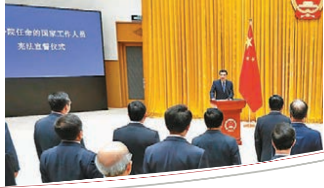
■昨日，國務院舉行憲法宣誓儀式，總理李克強監誓。中新社

人民對美好生活的嚮往就是我們的奮鬥目標，踐行使命，實幹擔當，清正廉潔，以更加飽滿的精神狀態、更加務實的工作作風勤勉盡責，促進經濟社會持續健康發展，為建設富強民主文明和諧美麗的社會主義現代化強國努力奮鬥。 國務院副總理韓正、孫春蘭、胡春華、劉鶴，國務委員王勇、趙克志，以及國務院有關部門主要負責人等參加儀式。