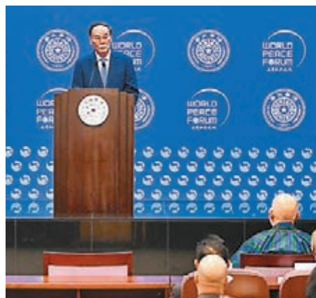
■昨日，王岐山出席第八屆世界和平論壇開幕式並致辭。新華社

香港文匯報訊 據新華社報道，以「穩定國際秩序：共擔、共治、共享」為主題的第八屆世界和平論壇8日在清華大學舉行，國家副主席王岐山出席開幕式並致辭。王岐山表示，中國始終堅定不移走和平發展道路，永不稱霸、永不擴張、永不謀求勢力範圍。呼籲各國堅守和平發展的信念，毫不動搖地推進經濟全球化，共同構建更加公正合理、穩定有效的國際秩序。