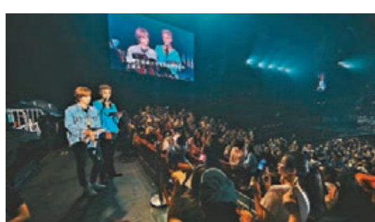
■WINNER的Mino和金秦禹走進觀眾席介紹。

上月爆出患上抑鬱症的泰妍，在台上展露笑容向觀眾揮手，唱出《Four Season》、《D》及《Blue》，獲觀眾大力支持，齊聲大合唱之餘，並高舉燈牌應援。