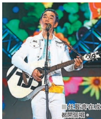
■任賢齊在成都開個唱。

香港文匯報訊(實習記者徐軒軒)任賢齊前日完成《齊跡2019》成都站巡迴演唱會，全場爆滿。一向喜歡吃辣的小齊，因為要演出，被公司禁制吃麻辣火鍋，最終他下令把火鍋搬上台，邊吃邊跟歌迷玩點唱。成都食物什麼都辣，他在台上也問觀眾，「聽說你們連小孩子喝的奶，也是麻辣味……」逗得全場觀眾開心大笑。點唱單元時，有成都歌迷點《我是你老婆》，坦白向小齊示愛道：「我是你老婆!我是衝着你來的!我們成都的老婆都愛你!」小齊最初呆一呆，接着就玩起來笑問：「你老公沒有來?沒有?那我們就不客氣啦，既然這樣，我不是要考慮住下來?哈哈!」問他每一站巡迴也有這麼多歌迷當他老公，公開示愛，他如何處理這些歌迷老婆?小齊就笑道，「我告訴你，我歌迷大部分是男生，很多老婆都是跟着老公來的!不信你去問問他們!我哪來這麼多福氣?我是沒能力當乖小寶的人，歌迷早已經把我當家人了!結婚生孩子抱孫都來通知我。」小齊剛完成蘇州的演出便馬不停蹄到成都，其間抽了半天時間清早快閃出遊，逛了成都書店買了模型玩具給囡囡及女兒，接着又去嘗試成都生活品茶及到杜甫草堂參觀。