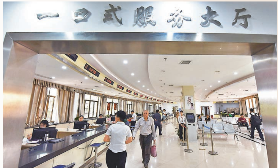
習近平強調，把有利於提升群眾獲得感的改革放在突出位置。圖為江西吉安吉州區行政審批實現全科服務、全程聯審、全網通辦。

要發揮好中央和地方兩個積極性，確保黨中央集中統一領導和國家制度統一、政令統一，中央和國家機關要做好對本行業本系統的指導和監督，地方在堅決貫徹黨中央決策部署的同時，要發揮主觀能動性，結合地方實際創造性開展工作。要推進相關配套改革，按照加快推進政事分開、事企分開、管辦分離的原則，深化事業單位改革，着力加強綜合行政執法隊伍建設，強化基層社會管理和公共服務職能，完善機構改革配套政策。要推進機構編制法定化，依法管理各類組織機構，繼續從嚴從緊控制機構編制。要增強幹事創業敢擔當的本領，準確把握新機