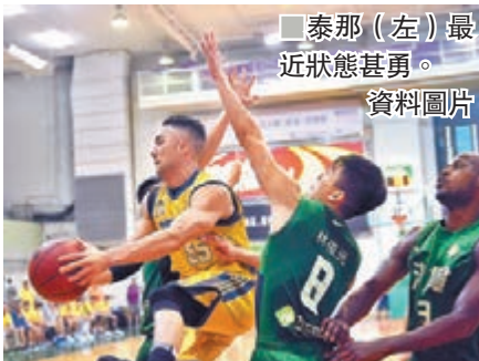
泰那(左)最近狀態甚勇。資料圖片