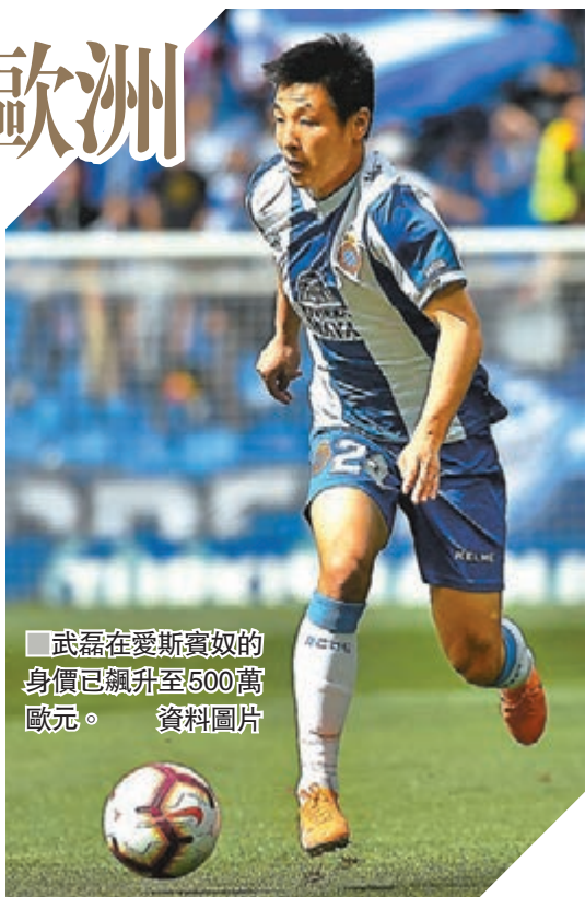
武磊在愛斯賓奴的身價已飆升至500萬歐元。