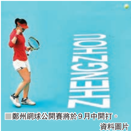
鄭州網球公開賽將於9月中開打。資料圖片