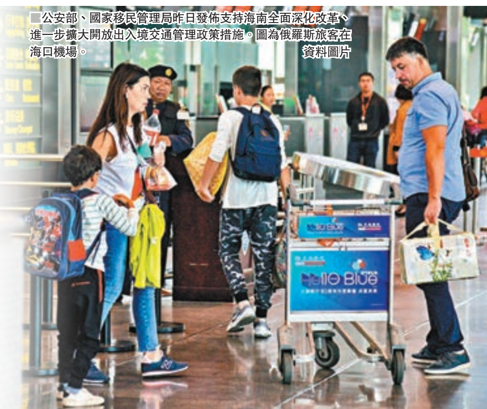
公安部、國家移民管理局昨日發佈支持海南全面深化改革、進一步擴大開放出入境交通管理政策。圖為俄羅斯旅客在海口機場。

12項措施還包括便捷的高端旅遊出入境服務措施，包括外國旅遊團乘坐郵輪15天入境免簽政策，簡化瓊港澳遊艇出入港（港）手續；對前往博鰲樂城國際醫療旅遊先行區等海南醫療機構診療的外籍患者及其陪護家屬，提供申請辦理簽證或居留許可便利等。