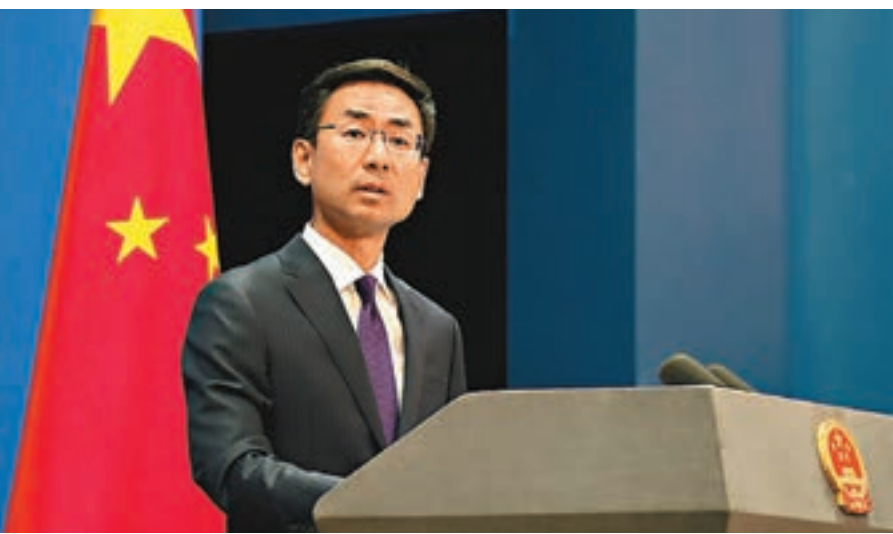
■耿爽表示，中國外交部已經連續兩天就侯俊偉的涉港錯誤言論作出回應，表達了中方的強烈不滿和堅決反對。

侯俊偉聲言「香港居民的自由是英方爭取來的」，耿爽狠批這種說法「簡直是厚顏無恥」：「我想問問亨特（侯俊偉）先生，在英國對香港進行殖民統治期間，香港有何民主可言？港人連上街遊行的權利都沒有。恰恰是香港回歸後，中國政府依照憲法和基本法，切實貫徹落實『一國兩制』、『港人治港』、高度自治方針，保障香港居民依法享有前所未有的民主權利和自由。」