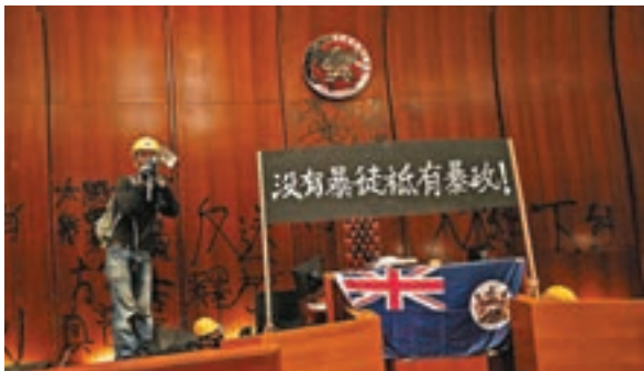
■7月1日，暴徒闖入立法會大肆破壞，更在會議廳掛上港英旗。資料圖片

發言人重申：「我們再次嚴正要求英方正視香港已經回歸祖國22年的現實，糾正錯誤，迷途知返，遵守國際法和國際關係基本準則，尊重中國主權，立即停止干涉香港事務和中國內政，停止在錯誤的道路上越走越遠。」