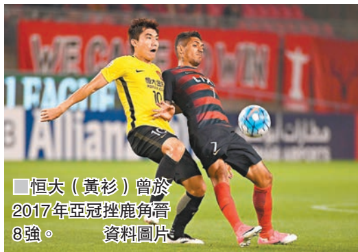
恒大（黃衫）曾於2017年亞冠挫鹿角晉8強。資料圖片

四分之一決賽開打之前，各隊可以對名單進行一次調整，首回合比賽將在8月26、27日進行，次回合9月16、17日打響。兩支中國球隊先後主客。