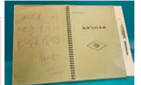
■楊利偉記錄的訓練日記。楊利偉是中國培養的第一代航天員，也是中國進入太空第一人。