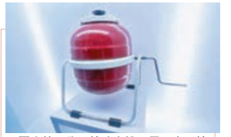
■國產第一代手搖洗衣機，需要人手搖動洗衣，售價60元，相等於當時一般工人的兩個月工資，更需有票證才可買到。