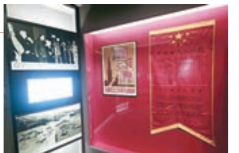
■香港大公報職工獻給人民解放軍的題詩與簽名錦旗。