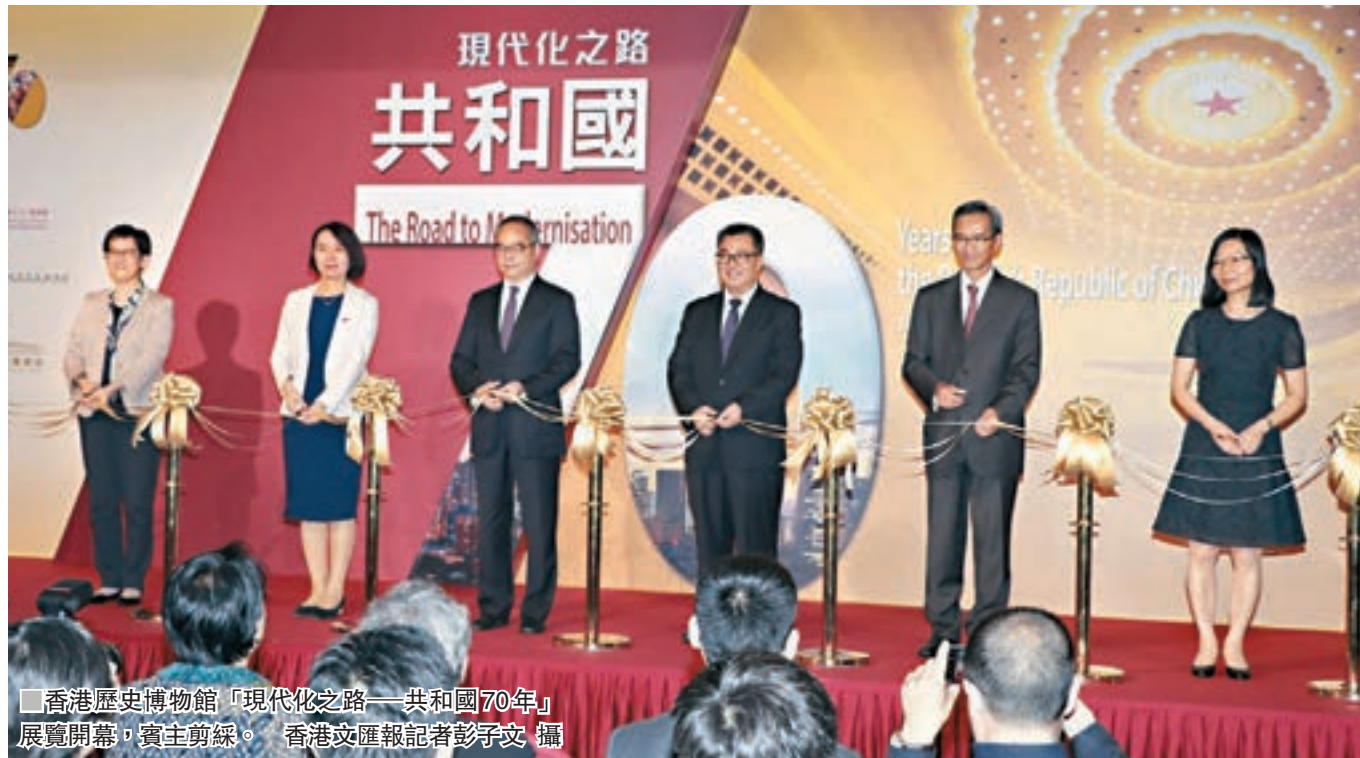
■香港歷史博物館「現代化之路—共和國70年」展覽開幕，賓主剪綵。

香港文匯報訊（記者 馮健文）香港特區為慶祝中華人民共和國成立70周年的重點項目之一、「現代化之路—共和國70年」展覽，由今日起至下月26日在香港歷史博物館展出，透過逾210件/套中國國家博物館和香港歷史博物館館藏的珍貴文物，展現中國現代化的建設成就，增進市民特別是青年人對國家的認識。展覽免費入場，預計為期兩個月的展期，可吸引6萬至8萬人入場參觀。