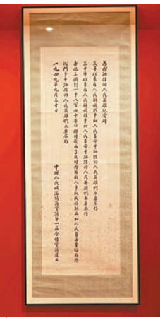
■已故國家領導人周恩來書寫的人民英雄紀念碑碑文，屬於國家一級文物。矗立在北京的人民英雄紀念碑，於1958年5月1日建成揭幕。