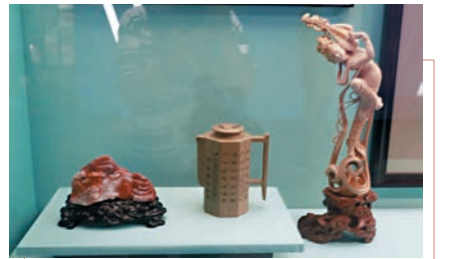
■高公博創作的《敦煌樂天》黃楊木雕。高公博是中國工藝美術大師，也是中國非物質文化遺產國家級項目代表性傳承人。