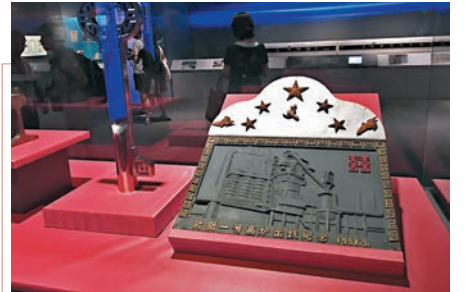
■武漢鋼鐵公司一號高爐煉出第一爐鐵水，武鋼職工鑄造了此件浮雕，以作紀念。武鋼是新中國的第一座大型鋼鐵聯合企業。