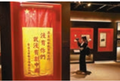
■香港文匯報全體職工獻給人民解放軍的錦旗，寫上「沒有你們就沒有新中國」。