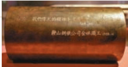
■鞍山鋼鐵公司全體職工獻給已故國家領導人毛澤東的一段國產第一根無縫鋼管。鞍鋼無縫鋼管廠是新中國第一座無縫鋼管廠，也是首批建成的大型現代化骨幹工程之一。