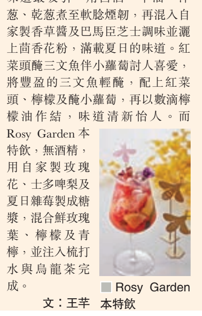
Rosy Garden 本特飲

禪悟居士，正職與玄學、術數無關，信奉藏傳佛教，自初中開始在「玄學發燒友」父親耳濡目染下接觸面相、紫微斗數、八字等知識，再經父介紹認識了教授佛法之恩師，除學習佛學之外，恩師亦傳他文王卦及陽宅風水至今35個年頭。2013年通過禪定，悟得前所未有的契悟，終明白了五行與際遇實相之間的關聯性，像石破天驚一樣，整合了一套獨一無二、與宇宙本體相應的禪悟姓名學，依此因緣，新以公開部分千古未傳姓名學之奧秘，望有緣人得到裨益！ facebook: 禪悟—千古未傳姓名推命學