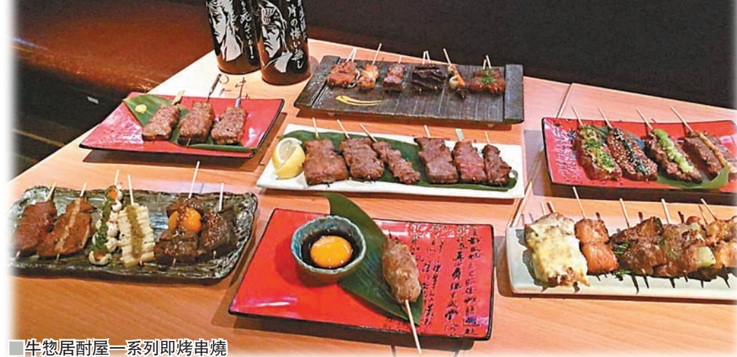
牛惣居耐屋一系列即烤串燒

香港常見的串燒店，主要食材通常以雞為主，如用牛來做，通常都是以牛肉、牛舌等為主，而於銅鑼灣開設的全新日式牛串燒專門店「牛惣居耐屋」，有別於一般的串燒店，除了提供多款不同部位的牛肉串燒及以牛為主題的料理之外，更有市面少見的牛內臟串燒，如牛骨髓、牛沙瓜、牛橫隔膜等，食得刁鑽，牛癡者不容錯過。 文：雨文