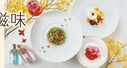
味道最吸引，用白酒、牛油、洋葱、乾葱煮至軟脆煙韌，再混入自家製香草醬及巴馬臣芝士調味並灑上茴香花粉，滿載夏日的味道。紅菜頭三文魚伴小蘿藦討人喜愛，將豐盈的三文魚輕醃，配上紅菜頭、檸檬及醃小蘿藦，再以數滴檸檬油作結，味道清新怡人。而 Rosy Garden 本特飲，無酒精，用自家製玫瑰水、士多啤梨及夏日雜莓製成糖漿，混合鮮玫瑰葉、檸檬及青檸，並注入梳打水與烏龍茶完成。

為迎接盛夏來臨，兩個百年品牌意大利餐飲界巨匠 COVA 與法國香氛美肌品牌 GUERLAIN 首度聯手，將美食與美態融會在這個獨一無二的餐單之中，帶來以繁華及蜂蜜為主題的清新夏日盛宴 Beauty & The Bees。這限定晚餐由即日起至7月31期間在銅鑼灣名牌林立的利園一期 COVA Ristorante-Caffe 供應，餐廳環境非常歐洲風味，適合班完名店的人士光顧，延續那份高雅氣息。 該限定晚餐為二人晚餐(兩位HK$888)有五道菜式，菜式中文織出 Guerlain 具標誌性的花草水語香氛系列，清新爽逸的初夏氣息及經典殿堂級蜂蜜系列的滋潤蜂蜜，每道菜式從食材、烹調至擺盤均恰恰好處地融入盛夏的花蕾芳香甜美，讓食客有如置身意大利的阿爾卑斯翠綠山嶺及普羅旺斯的盛放花海，開展一場跨越南歐的味覺之旅。 當中以自家製香草汁燴意大利飯