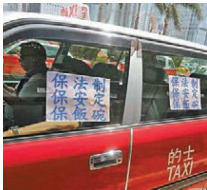
的士貼有「保法制、保安定、保飯碗」標語進行請願。