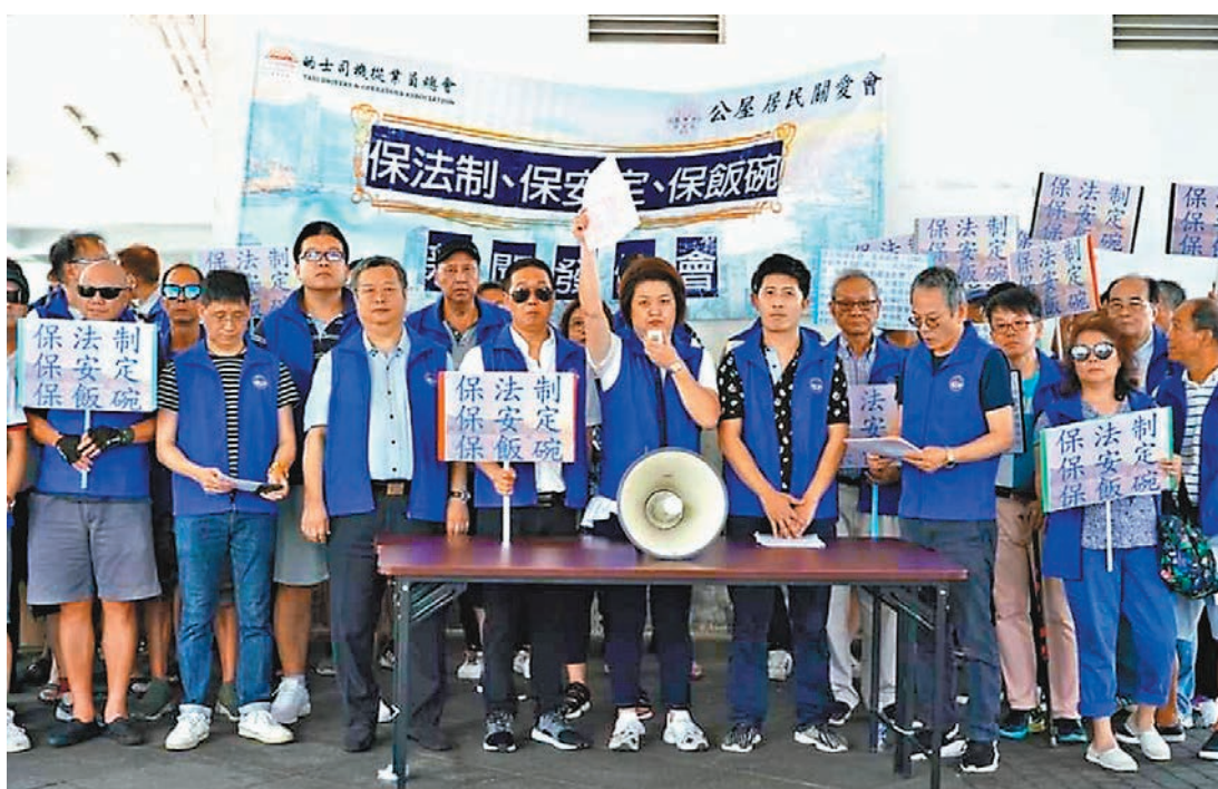
香港的士司機從業員總會及香港公屋居民關愛會昨日則發起請願，呼籲示威者停止對抗。