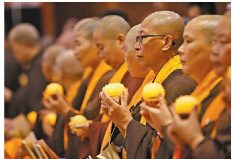
逾千佛教居士誦經祈福。