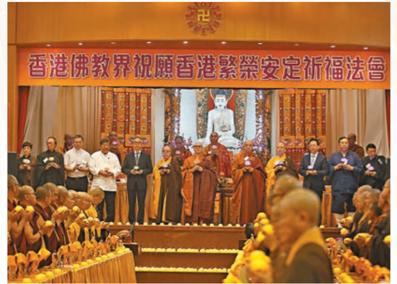
佛教界舉行「祝願香港繁榮安定祈福法會」。

祈福法會由漢傳、藏傳和南傳佛教大德法師主法，兩個禮堂滿座，超過150位法師聯同逾千名佛教居士誦經共修，為香港祈福。