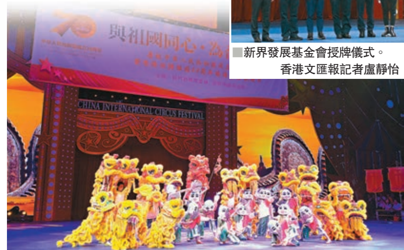
新界各界舉行歡慶日活動與國慶及回歸。香港文匯報記者盧靜怡攝