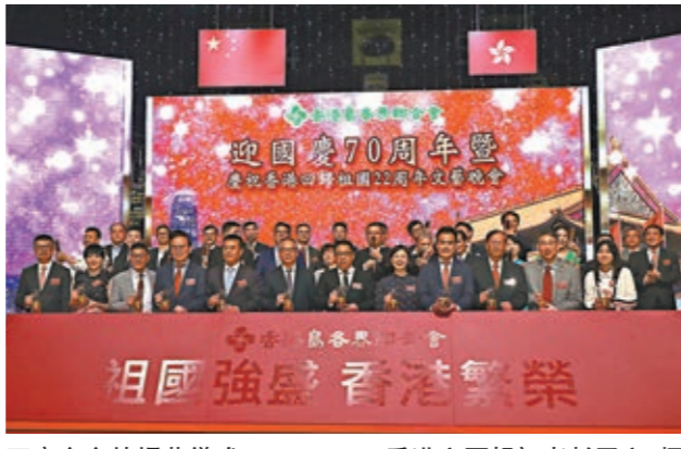
晚會主辦主持揭幕儀式。

他細說，香港的成就來得不易必須珍惜。最近社會有人肆意撥亂社會秩序和安寧，已經影響民生、禍及市民，其中港島區居民感受更深，期望社會回復理性，發揮正能量，支持特區政府依法施政，回歸安定的環境，讓香港繼續前行。