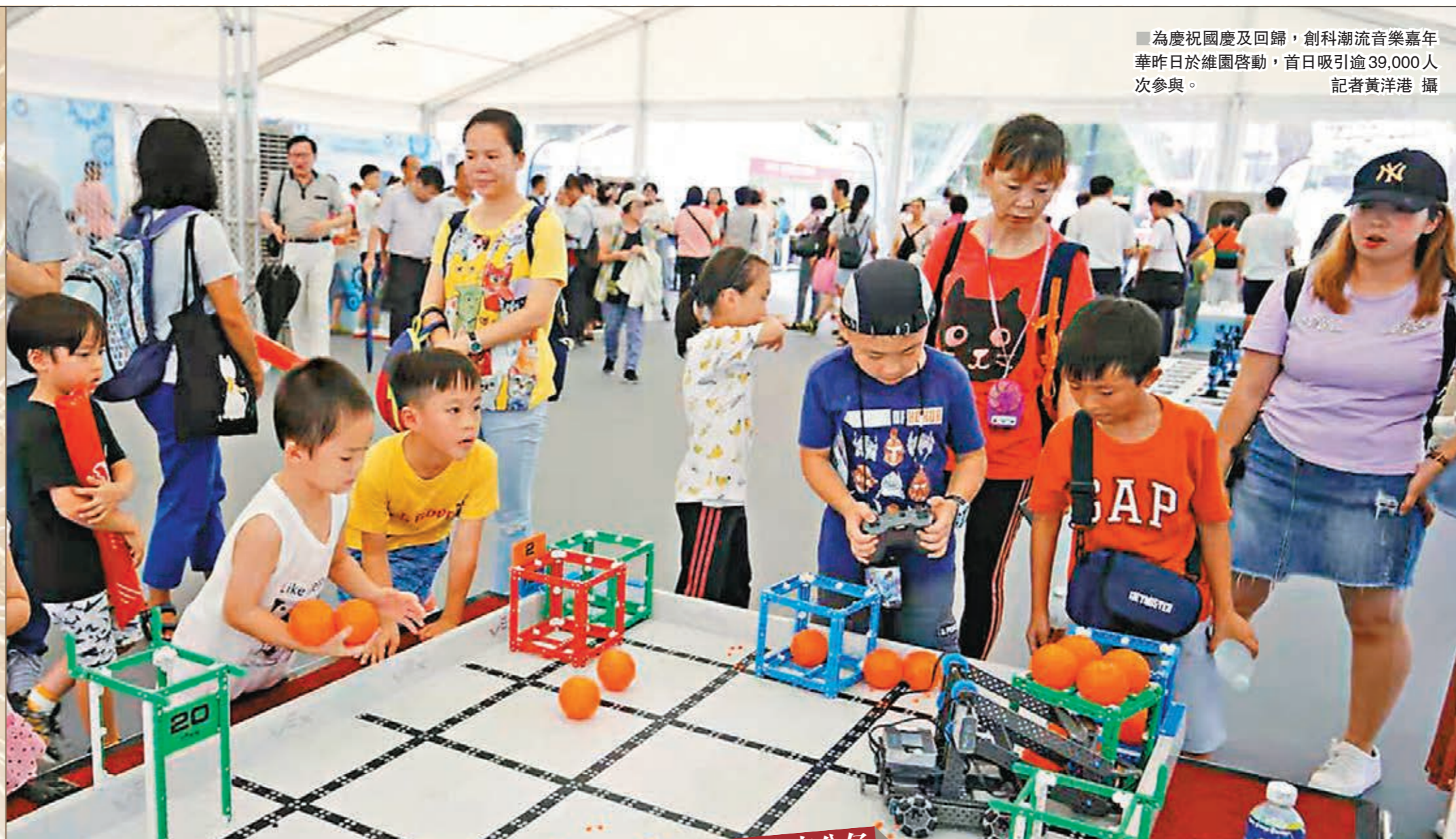
為慶祝國慶及回歸，創科潮流音樂嘉年華昨日於維園啟動，首日吸引逾39,000人次參與。