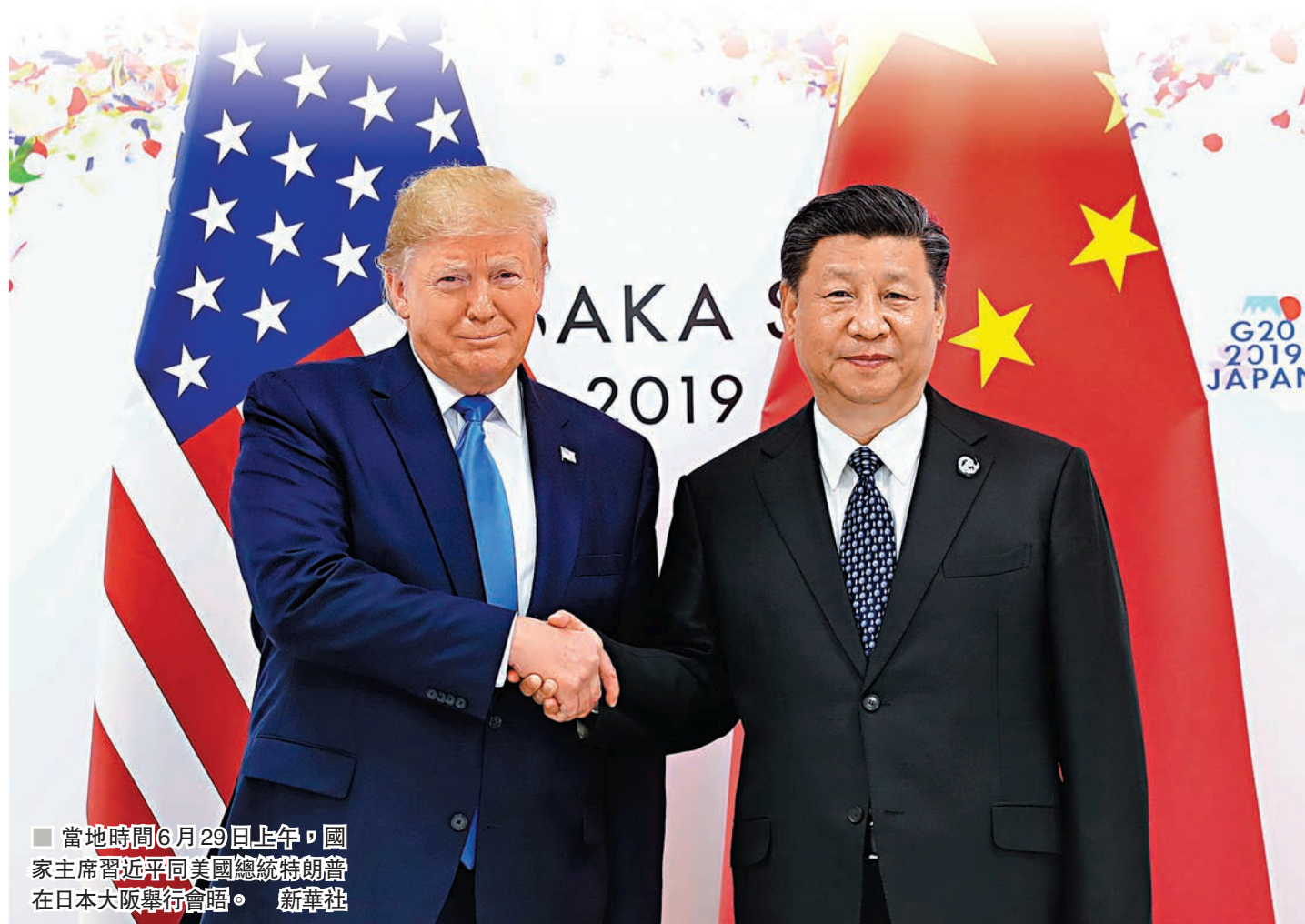
■ 當地時間6月29日上午，國家主席習近平同美國總統特朗普在日本大阪舉行會晤。

香港文匯報訊 中國國家主席習近平29日同美國總統特朗普在大阪舉行會晤。兩國元首同意，在平等和相互尊重基礎上重啟經貿磋商，美方不再對中國產品加徵新的關稅。兩國經貿團隊將就具體問題進行討論。