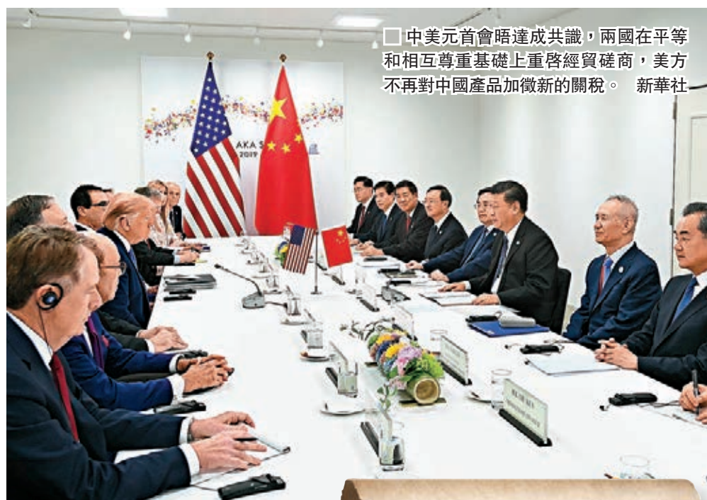
■ 中美元首會晤達成共識，兩國在平等和相互尊重基礎上重啟經貿磋商，美方不再對中國產品加徵新的關稅。

香港文匯報訊 中國國家主席習近平29日同美國總統特朗普在大阪舉行會晤。兩國元首同意，在平等和相互尊重基礎上重啟經貿磋商，美方不再對中國產品加徵新的關稅。兩國經貿團隊將就具體問題進行討論。