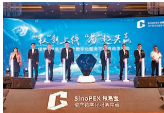
綠地「權易寶」資產數字化服務平台上線。

「借助最新的科技手段、依託不斷完善的法律法規活化巨大的存量市場，已進入比較有利的窗口時期」耿靖說，未來3年內「權易寶」平台計劃累計實現使用權流轉規模超過千億元。