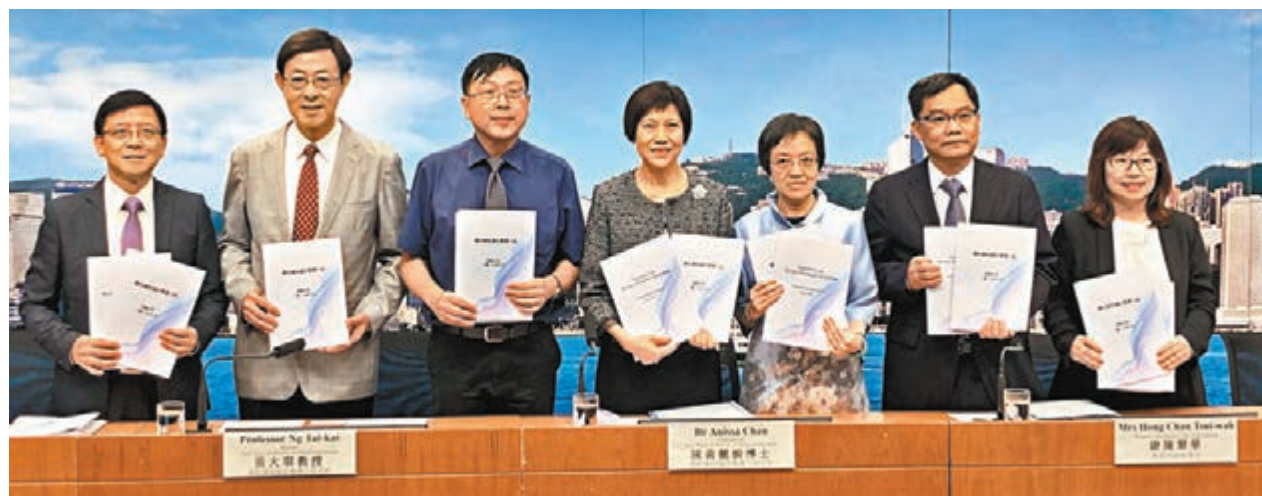
小組建議高中四個核心科目維持必修必考。

建議亦提到，中小學要加強STEM教育，培養學生運用知識，解決日常問題的能力，進一步彰顯全人發展重要性，以及進一步推廣應用學習，同時增加學生選擇應用學習作為選修科目的誘因。