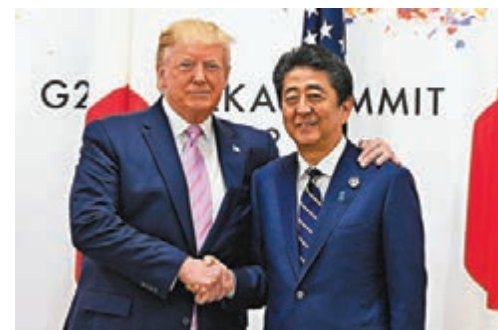
■日本首相安倍晉三昨日上午在大阪與美國總統特朗普舉行會談。

此次會談是美日兩國領導人在短短三個月內的第三次會面。《日本時報》報道稱，這顯示了二人密切的個人關係。一位高級官員上周表示，特朗普和安倍晉三將彼此「協調」要在G20峰會上討論的議題，這顯示兩國站在了一起。