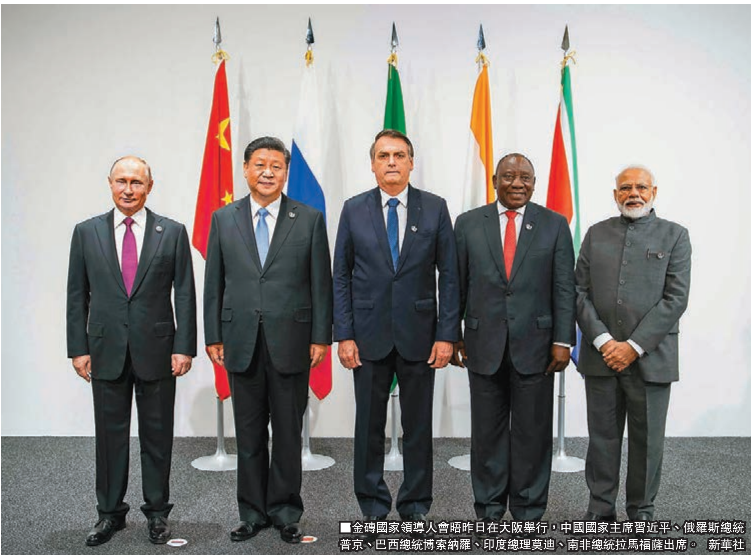
■金磚國家領導人會晤昨日在大阪舉行，中國國家主席習近平、俄羅斯總統普京、巴西總統博索納羅、印度總理莫迪、南非總統拉馬福薩出席。新華社

香港文匯報訊 據新華社報道，金磚國家領導人會晤28日在日本大阪舉行。中國國家主席習近平、巴西總統博索納羅、俄羅斯總統普京、印度總理莫迪、南非總統拉馬福薩出席。與會各國領導人表示，金磚國家要更加展現我們團結合作的戰略價值，堅定維護發展中國家的發展權利，提高新興經濟體和發展中國家在國際事務中的地位。