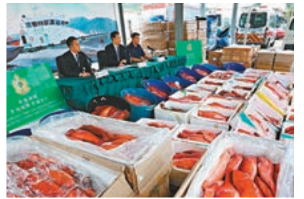
海關展示檢獲的走私冰鮮東星斑。

香港文匯報訊（記者 蕭景源）由來貨、分發、至散貨一條龍走私集團，利用快艇走私高價海鮮回內地，全程僅需兩個小時。海關追查後埋伏監視，在私泉在沙頭角海邊準備出貨時，截獲6輛貨車及8艘快艇，檢獲5.2公噸、值約100萬元的高價冰鮮魚，拘捕8名本地男子，同時搜查5間公司，檢走大批文件，相信已將該走私集團搗破。