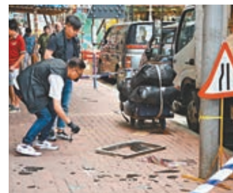
探員檢查高空墜街的鋁窗。

方婦驚魂甫定自行報警，由救護車送院治理。警員登樓調查，相信鋁窗來自2樓一個單位，調查後將單位女戶主拘捕。