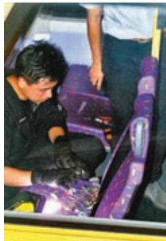
爆炸品處理人員證實盒內無爆炸裝置。