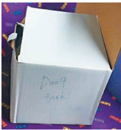
盒上寫有「Don't Touch!」字句。

發現懷疑炸彈，呼籲市民避免前往上址一帶。及至晚上7時，身穿防暴裝備的爆炸品處理人員經小心檢視可疑紙盒後，成功在車廂內進行引爆，結果證實盒內只有一堆電線及電子零件，並無炸藥和爆炸裝置，亦無其他恐嚇字句，遂將現場轉交警員繼續跟進，附近道路亦隨即解封。案件交灣仔警區刑事調查隊第二隊跟進。