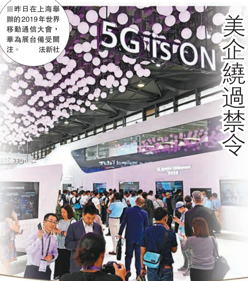
昨日在上海舉行的2019年世界移動通信大會，華為展台備受關注。