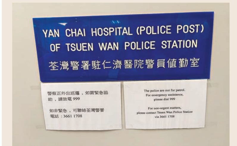
■警方告示稱,如需要緊急協助請致電999。