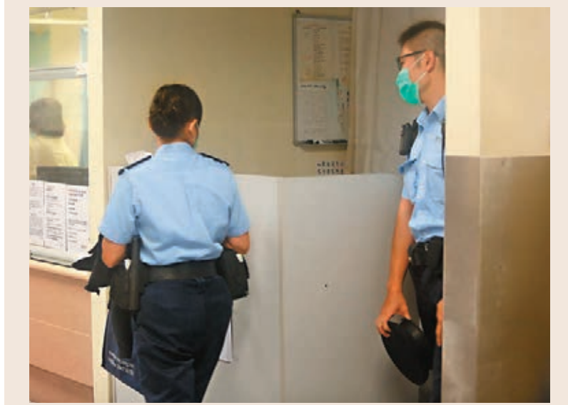
■警員在荃灣仁濟醫院警崗貼上告示後離開。