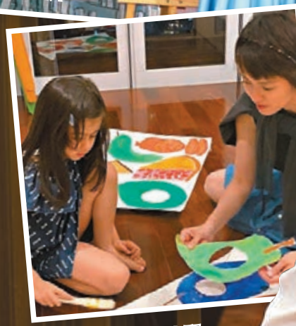
■梁詠琪用更多時間照顧屋企。