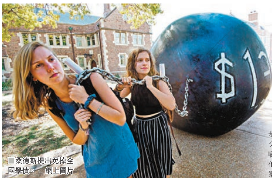
桑德斯提出免掉全國學債。