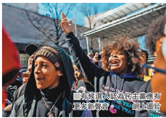
有候選人認為民主黨應有更多新聲音。