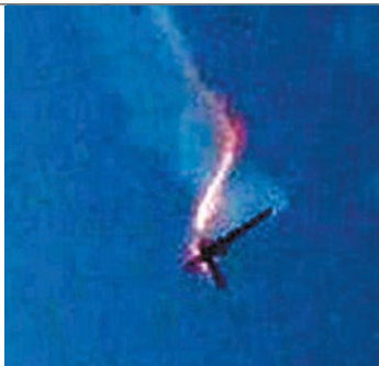
■ 伊朗上周擊落美軍無人機。網上圖片

美聯社引述3名匿名華府官員稱，本月較早前兩艘油輪於霍爾木茲海峽遇襲後，國防部官員已建議攻擊伊朗軍方的電腦系統，隨着中東局勢趨緊張，當局一直部署網攻行動，直至無人機被擊落後，特朗普決定授權發動網攻。