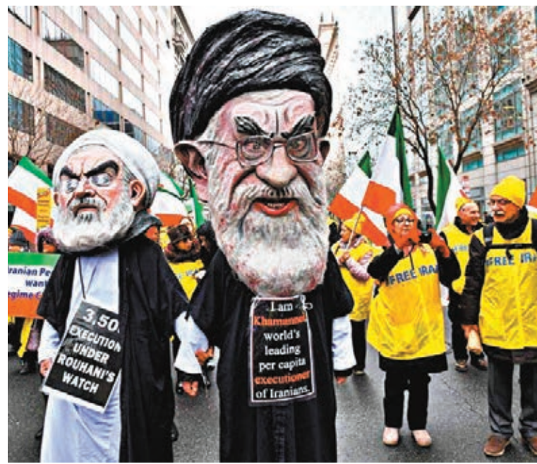
■ 有示威者打扮成伊朗總統魯哈尼(左)和最高精神領袖哈梅內伊。網上圖片

另一方面，美國國土安全部前日發表聲明，指網絡保安企業CrowdStrike和FireEye發現，最近數周有相信為伊朗政府工作的黑客，透過散播「魚叉式網絡釣魚」電郵，企圖入侵美國政府機構和部分企業的網絡，涉及金融、石油和天然氣等範疇，但未知黑客是否成功入侵目標。國土安全部轄下網絡安全及基建安全部門主管克布斯指，正與情報機關及網絡安全夥伴合作，監察伊朗的網絡活動，以確保美國及其盟友的安全。 ■綜合報道