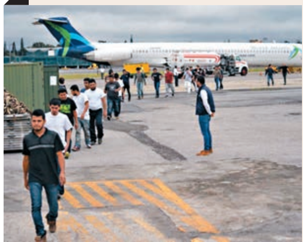
■ 美國上月遣返大批非法移民回危地馬拉。網上圖片

消息人士透露，民主黨籍眾議院議長佩洛西上周五晚致電特朗普，要求取消遣捕行動。佩洛西前日稱，歡迎特朗普推遲行動，指出在移民問題上實現全面改革需要時間。 ■美聯社/路透社