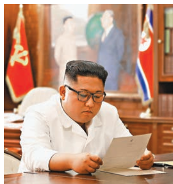
■ 朝鮮公開金正恩閱讀特朗普親筆信的照片。

朝鮮官方媒體朝中社昨日報道，最高領導人金正恩收到來自美國總統特朗普的私人信函，金正恩形容信函內容「極佳」，對此感到滿意，並會認真考慮信中內容，但報道未有提及特朗普發信時間及具體內容。