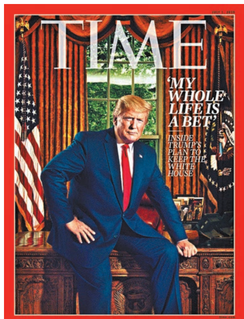
■ 最新一期《時代》刊出特朗普專訪。

據《時代》報道，特朗普受訪期間曾停止錄音，讓記者閱讀信件，而《時代》亦遵照規定，未有公開信件內容。 ■綜合報道