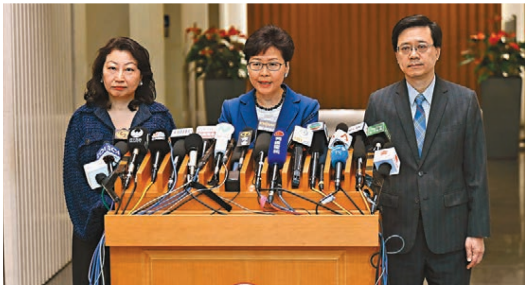
行政長官林鄭月娥、律政司司長鄭若驊及保安局局長李家超已就修例引起的社會紛爭而向市民致歉。