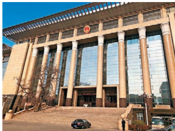
最高人民法院昨發文,提出禁止特別表決權股東濫用權利的司法政策。

展會主辦方透露,前期共收集的48個產融對接簽約項目中,意向性簽約總金額近3,500億元人民幣,有7個粵港澳大灣區項目首次在金交會中亮相,涵蓋建築、水務、集裝箱碼頭、鐵路等基礎設施項目。