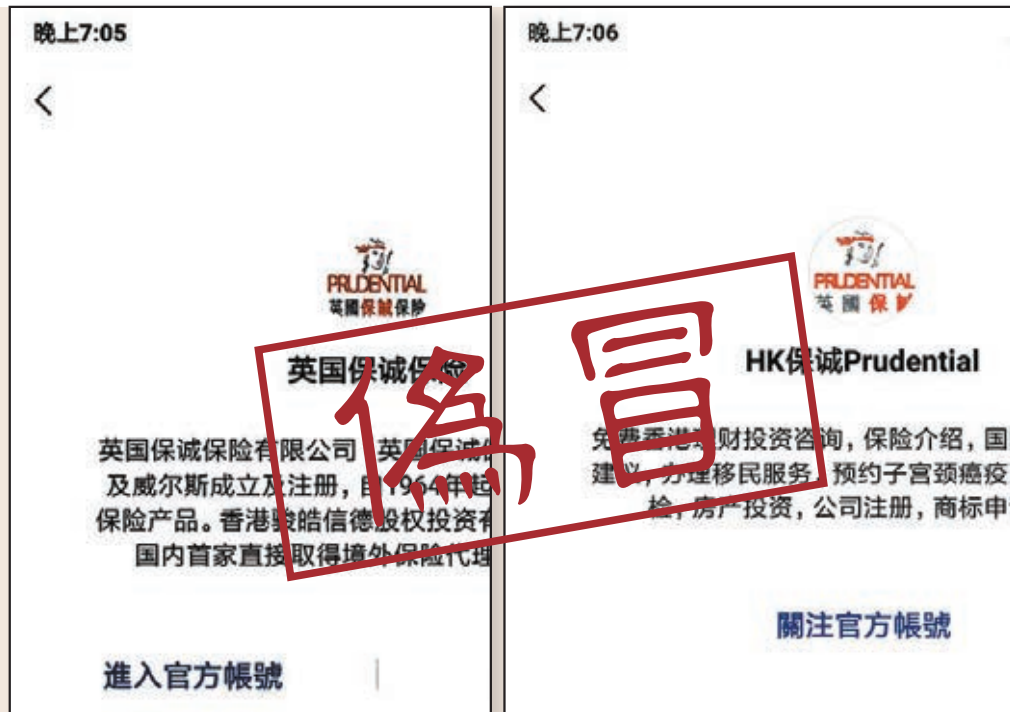
記者根據保監局的清單翻查,發現直至昨天晚上7時,部分有問題微信賬號仍然存在,而且其介面幾可亂真,消費者若不小心,即很容易掉進陷阱,從而蒙受損失。