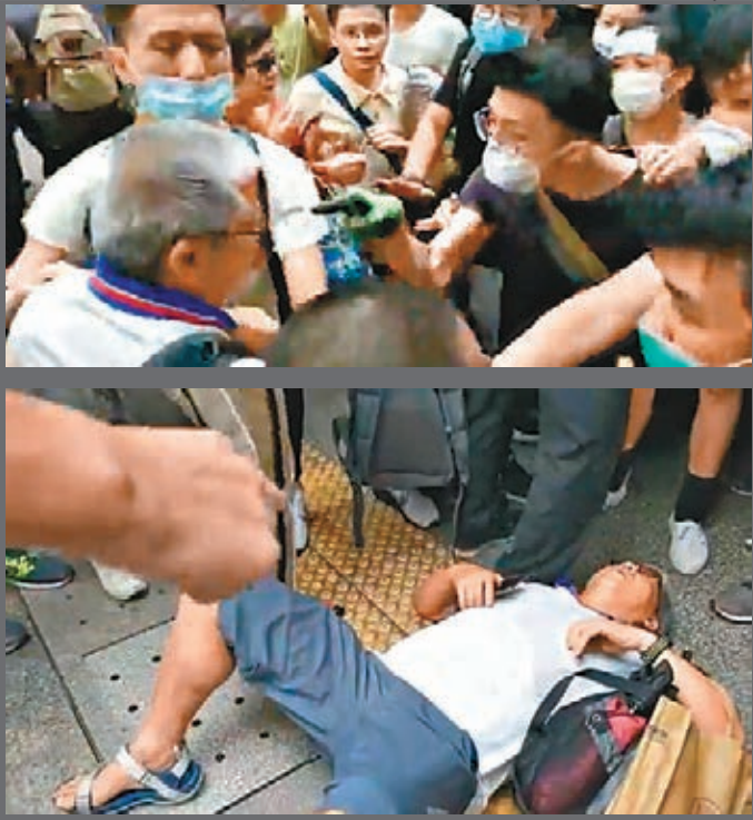
一名長者被示威者喝倒。

香港文匯報訊(記者 鍾立) 特區政府宣佈暫緩修訂《逃犯條例》後,反對派依然未肯罷手,繼續擾亂社會秩序,連日來不斷有示威者到金鐘一帶堵塞道路,昨日更開始發動「游擊戰」,先後到不同的政府辦公大樓搗亂兼阻塞出入口,企圖癱瘓政府,令全港市民一同「活受罪」。其間,示威者多次喝罵欲出入大樓的市民,有長者更在與示威者發生碰撞後跌倒在地。不少想到大樓內交表或辦公的市民抱怨示威者令他們「摸門釘」,有市民更狠批這些示威者擾民,影響社會秩序,做法「過火」,已超出可接受的界線。