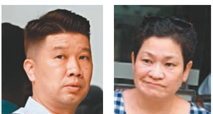
梁先生(左)及盧小姐。

熱點 民議 梁先生:我原本特地抽時間到稅務大樓交文件及查冊,現在什麼都做唔到。其實透過遊行示威表達訴求並無問題,但不應該堵塞道路、影響政府部門運作,這些手法影響整個社會。