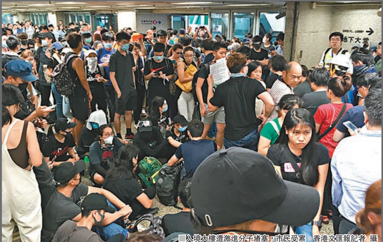
入境大樓遭激進分子堵塞,市民受累。