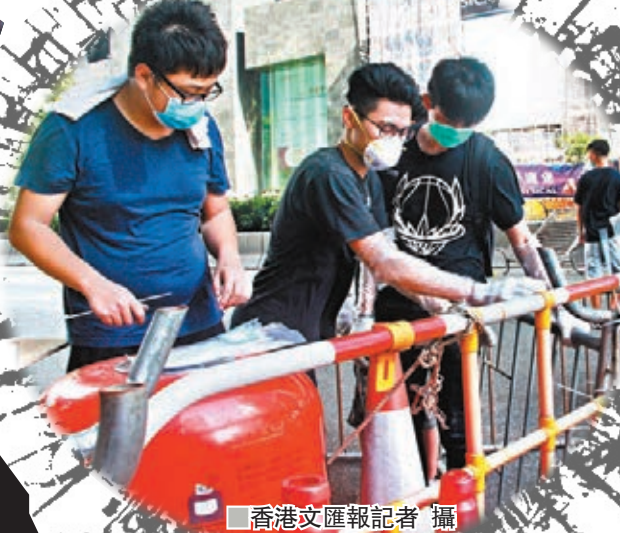
稅務大樓保安解釋要提早關門。