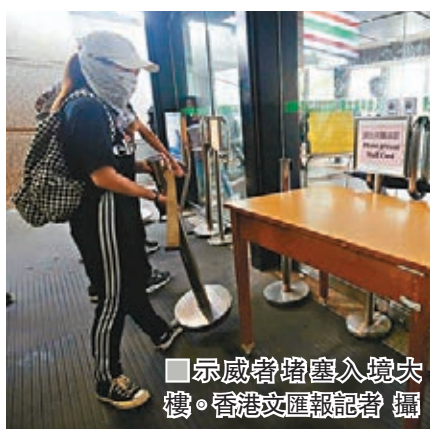
示威者堵塞入境大樓。