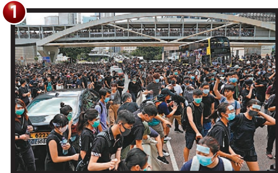
■示威者越過馬路，阻礙道路。