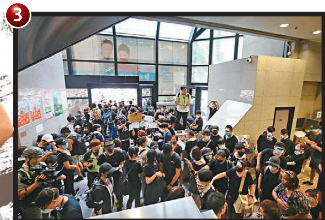
■示威者佔據稅務大樓，堵塞出入口。