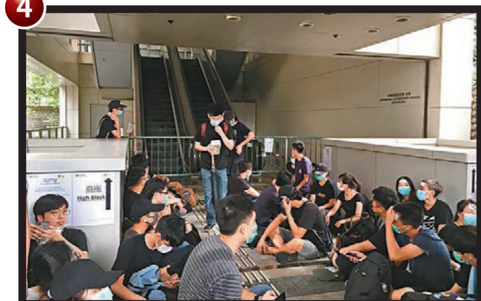
■黑衣男女封堵金鐘道政府合署。