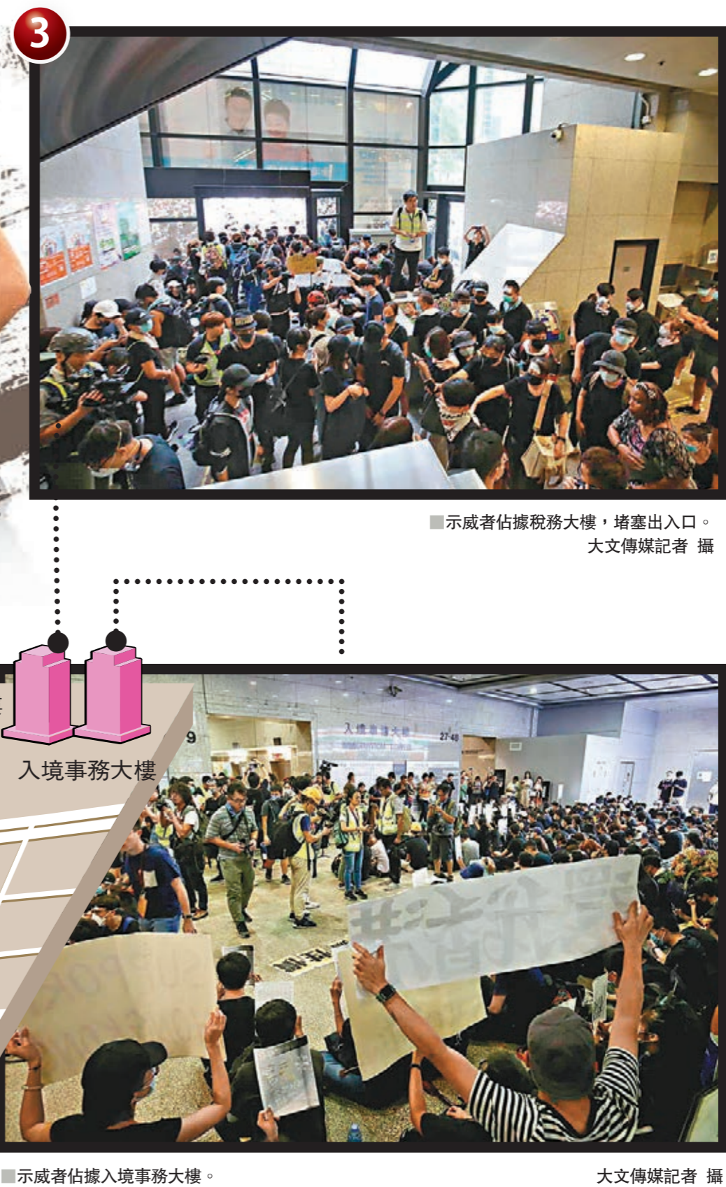
■示威者佔據入境事務大樓。