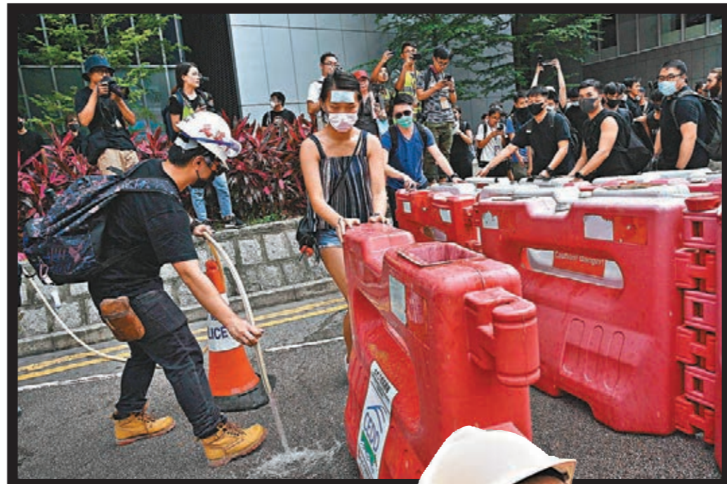
■示威者用水馬等路障封鎖附近主要幹道，佔領軍器廠街。