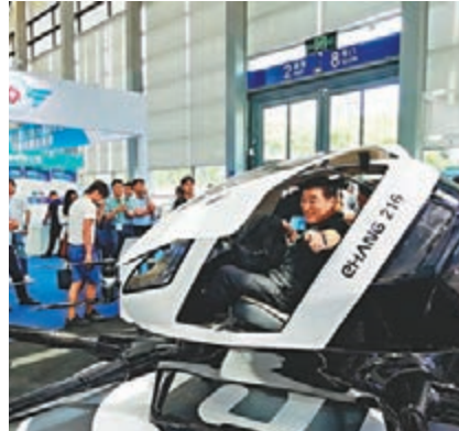
億航開發的智能無人駕駛飛機吸引了大批觀眾前來體驗。

長金良表示,隨著電商快速向二三線城市和農村市場滲透,為了提高效率 and 降低成本,公司研發的無人機物流運輸正在許多地試點。其快遞無人機目前在江西贛州進行小規模試點運行,無人機將農民土特產如農家雞蛋、生鮮等送到城市,每次可以載重10公斤,可以飛行半小時距離長達10公里。