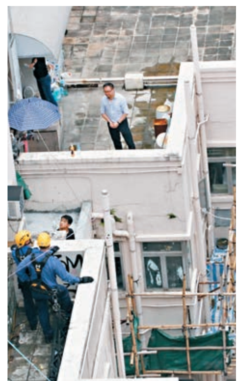
消防員在企跳男子旁戒備，警方談判專家在對面天台勸說。

香港文匯報訊(記者 蕭景源)一名疑受金錢困擾的男子，昨晨在尖沙咀金巴利道一幢大廈11樓天台危站，因地面環境狹窄，消防員不能張開救生氣墊，只能派出俗稱「飛將