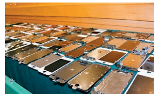
海關破獲冒牌手提電話配件維修工場。