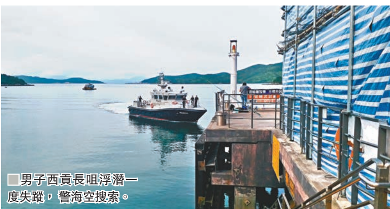
男子西貢長咀浮潛一度失蹤，警海空搜索。

香港文匯報訊(記者 蕭景源、鄧偉明)西貢長咀發生青年浮潛變5小時驚險「漂游」。四名青年昨乘舢舨到長咀對開海面玩浮潛，突然颶起大風，風速颶高10倍。其中一人被風吹離同伴後失蹤，友人搜索無果報警。水警、消防及飛行服務隊海空搜救，5小時後，正當眾人以為他凶多吉少之際，失蹤青年隨波漂流至兩公里外，在東灣現身及被安全救回。