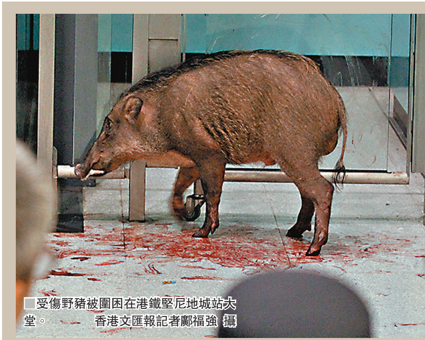
受傷野豬被圍困在港鐵堅尼地城站大堂。