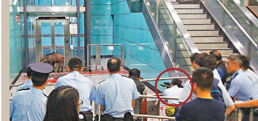
漁護署人員(紅圈示)向野豬發射麻醉槍。

至傍晚6時許，當小野豬沿統一碼頭道跑至中環灣仔繞道時，人員用麵包作餌將小野豬引入附近花槽後，隨即使用圍網進行圍封，最終將其捕獲捉入鐵籠。