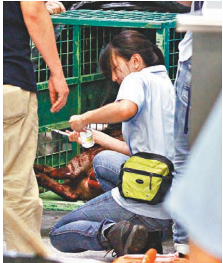
漁護署獸醫替野豬救治。