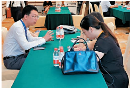
▲青創團隊現場與企業交流。◀第二屆海內外青年博士後珠海創新創業洽談會港澳及海外團隊專場。

此外，香港蟻知科技有限公司開發的線上預測平台「蟻知未來」，則通過打造一個預測熱門話題走向的大眾平台「蟻知」，並設特定的獎勵機制，除了讓大家集思廣益，還能對每次的偏差進行分析，通過修正，產生更準確的預測結果，宛如一個社區大腦。