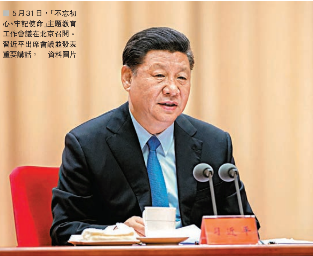
5月31日，「不忘初心、牢記使命」主題教育工作會議在北京召開。習近平出席會議並發表重要講話。

會議認為，黨的十八大報告明確指出，中央政府對香港、澳門各項方針政策的根本宗旨是，維護國家主權、安全、發展利益，保持香港、澳門長期繁榮穩定。習近平總書記2017年「七一」視察香港時作出「我們既要把實行社會主義制度的內地建設好，也要把實行資本主義制度的香港建設好」的鄭重宣示。黨的十九大會報告把「堅持『一國兩制』和推進祖國統一」確定為新時代堅持和發展中國特色社會主義的十四條基本方略之一，並提出「支持香港、澳門融入國家發展大局」「讓香港、澳門同胞同祖國人民共擔民族復興的歷史責任、共享祖國繁榮富強的偉大榮光」。習近平總書記去年「11·12」會見香港、澳門各界慶祝國家改革開放40周年訪問團時，向廣大港澳同胞和內地人民發出「為創造港澳同胞更加美好的生