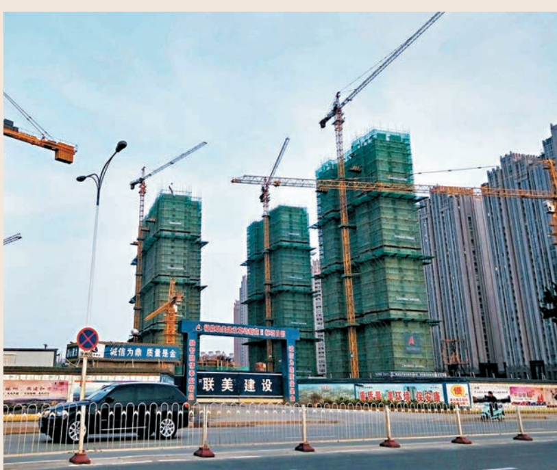
■分析指今年初以來因資金寬鬆導致的樓市小陽春，在政策影響下退燒，6月至8月市場可能會進入新一輪的調整期。

路透社根據國家統計局數據測算，5月70個大中城市新建商品住宅價格指數同比升10.7%，升幅與前月持平，連漲44個月；環比上漲0.7%，連漲49個月，漲幅比前月的0.6%有所擴大。