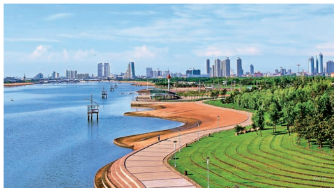
■日照水上運動基地