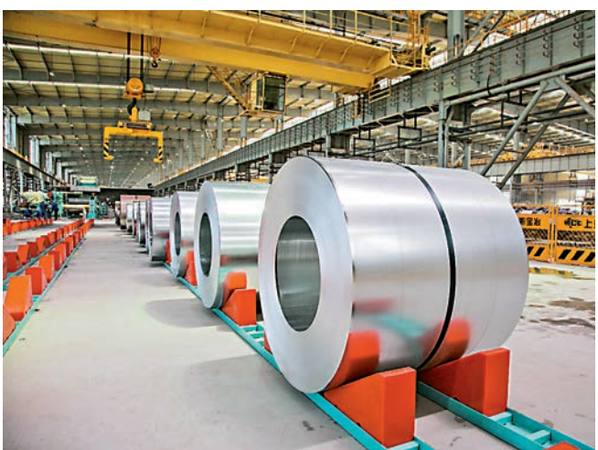
■山鋼日照鋼鐵精品基地地板材生產線

日照因「日出初光先照」而得名，位於山東半島南翼，是黃海之濱的一顆璀璨明珠。當前，日照市正在實施「開放活市」戰略，大力推動「雙招雙引」，着力打造「創新之城、生態之城、旅遊之城、活力之城、藍色之城」，加快建設美麗富饒、生態宜居、充滿活力的現代化海濱城市。