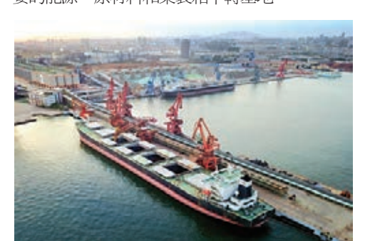
■日照港裕廊公司散糧接卸專用泊位

未來一段時期，日照港將以建設世界一流海洋強港為目標，實施新舊動能轉換工程，加快港口轉型升級，鞏固提升大宗散貨運輸優勢，做優做強集裝箱運輸、現代物流和現代海洋工程裝備業務，建設誠信、智慧、高效、綠色「四型港口」。到2023年吞吐量達到5億噸，集裝箱達到600萬標箱，把日照港建設成為「一帶一路」綜合性樞紐港，全球重要的能源、原材料和集裝箱中轉基地。