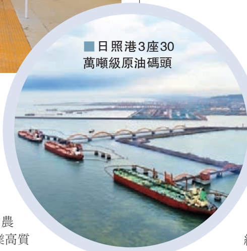
■日照港3座30萬噸級原油碼頭