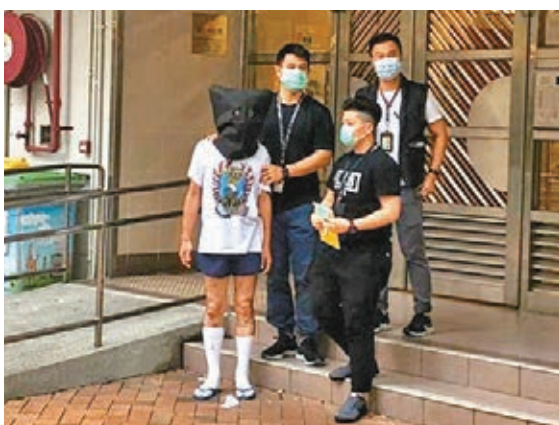
刀劫夜歸女子案男疑犯落網。

子女已長大投身社會,夫婦與其兩名子女同住錦泰苑錦麗閣27樓一單位。 昨午5時許,當時夫婦趁子女外出期間,兩人相繼由寓所墮下在大廈對開空地,巨響聲驚動保安員報警;救護員趕至證實兩人死亡。警員封鎖現場調查,證實兩人為高層一單位住戶,因單位反鎖無人應,由消防員協助破門入屋,發現單位廚房的窗戶打開,窗前一張檯,相信兩人由該處墮下,另在屋內檢獲啤酒罐及藥物。警方為慎重起見,由沙田警區重案組及法醫到場勘察,法醫發現死者頸部有勒痕,眼睛充血,疑被人勒頸失去抵抗,復被推落樓,惟動機仍有待進一步調查。