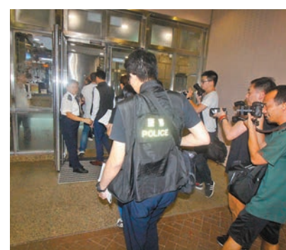
重案組探員一度到場調查。