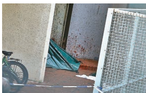
警員封鎖現場及用帳篷遮擋夫婦遺體進行調查。