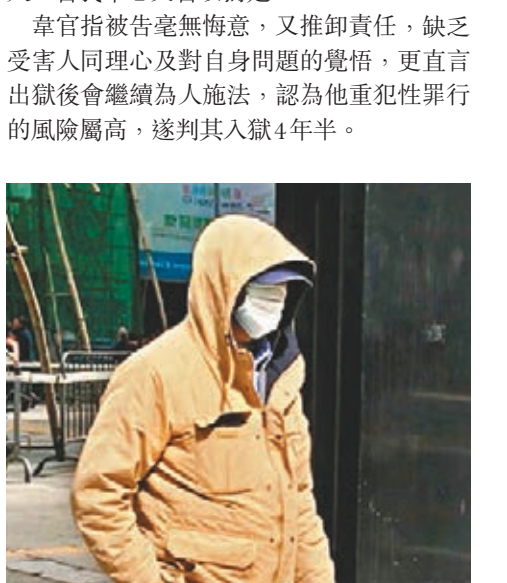
藉驅妖非禮母女的「道士」被囚4年半。資料圖片

韋官指被告每次趁X抽搐病發後，身體疲累及精神不振時乘人之危，行為實屬卑劣。被告侵犯完X後更意猶未盡，同一晚闖進其年僅15歲女兒Y的房間作出非禮，被發現時更辯稱是為她「驗屍毒」，顯示被告有相當程度的應變能力及為人狡詐。