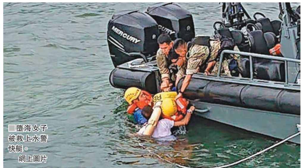
墮海女子被救上水警快艇。

香港文匯報訊(記者 蕭景源)一名外籍女子昨午突在中環港灣碼頭附近蹈海，幸剛有休班警經過，立即落水拯救，免其沒頂，稍後消防及水警趕至，合力將半昏迷女事主救上岸，再送院治理，警方調查後相信無可疑，列作企圖自殺案處理。