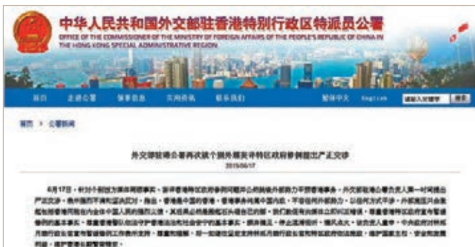
外交公署再就個別西方媒體公然挑唆提嚴正交涉。

該負責人重申，中央政府對林鄭月娥行政長官宣佈暫緩修例工作表示支持、尊重和理解，將一如既往堅定支持林鄭月娥行政長官和特區政府依法施政，維護國家主權、安全和發展利益，維護香港長期繁榮穩定。