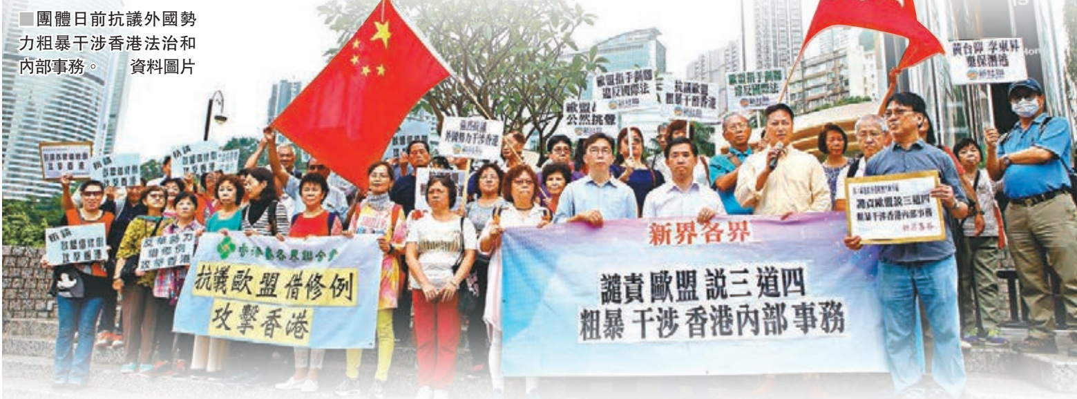
團體日前抗議外國勢力粗暴干涉香港法治和內部事務。資料圖片

香港修訂《逃犯條例》，本來就是一個堵塞法律漏洞、完善香港在國際上打擊跨境罪行的本地法律事宜。但自特區政府提出修例以來，一再有美國和西方勢力干預，除了這些外國政客紛紛發表以偏概全的言論，英美外媒體亦一再發功，使出三大賤招去干預修例一事，包括作出報道誣衊中央「施壓」、借無名無姓的「法官」抹黑修例，及一再引述美國政客意見去對修例一事說三道四。對於個別西方媒體罔顧事實、妄評香港特區政府修例問題並公然挑唆外部勢力干預香港事務，中國外交部、外交部駐港特派員公署以及香港特區政府均已第一時間作出駁斥。 ■香港文匯報記者 杜思文