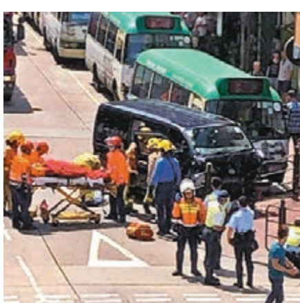
客貨車乘客送院。