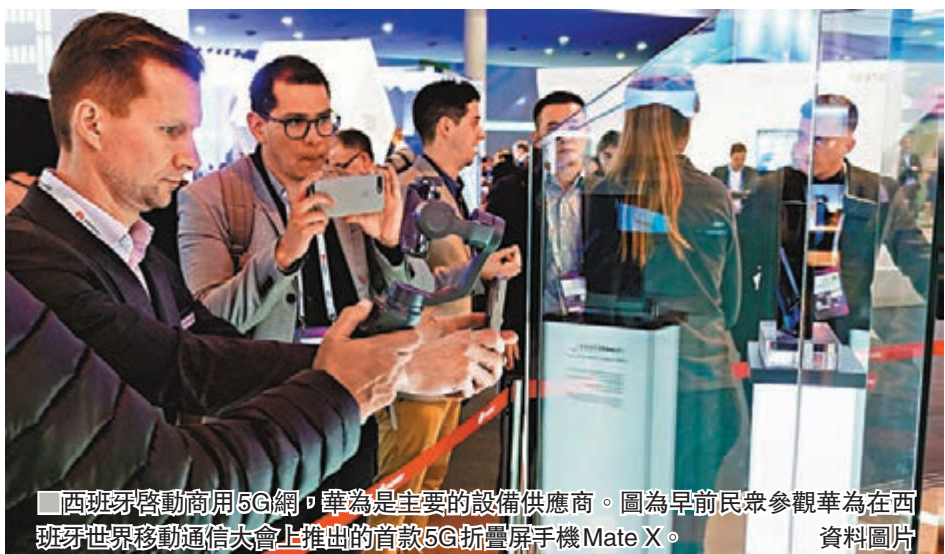
西班牙啟動商用5G網，華為是主要的設備供應商。圖為早前民眾參觀華為在西班牙世界移動通信大會上推出的首款5G折疊屏手機Mate X。 資料圖片

除此之外，西班牙經濟學家胡安·杜高雷斯表示，美國對華為的打壓可以說是搬起石頭砸自己的腳，其做法反而會給美國本土及其西方盟友的公司帶來不利影響。西班牙巴塞隆拿大學經濟系教授胡安·杜高雷斯則表示，從某種程度上說，美國的制裁不僅是針對中國，甚至會影響在美國本土的公司和其他一些與美國是盟友的西方國家的公司。