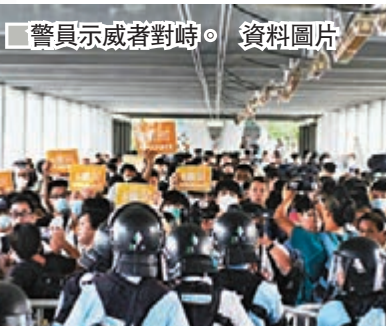
警員示威者對峙。資料圖片