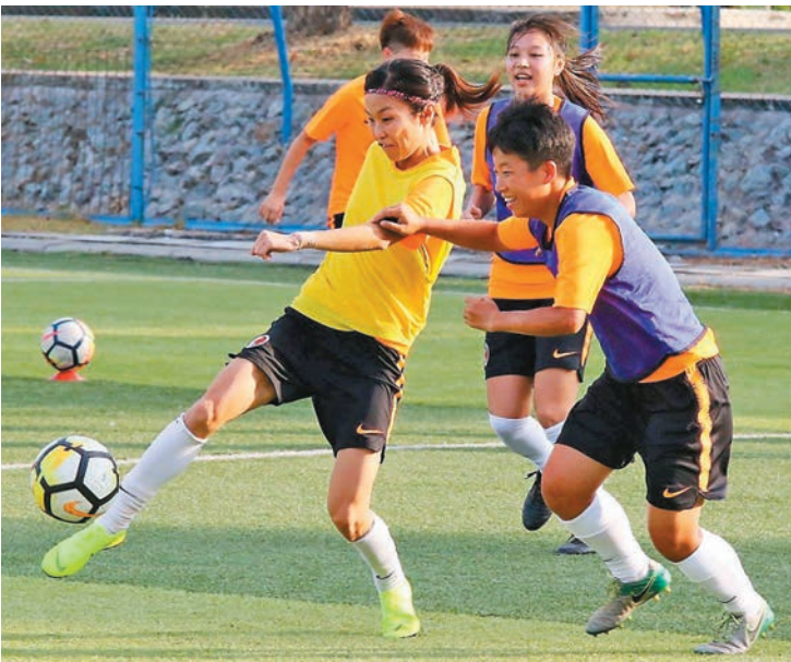
■香港女足將長期集訓，期望更上一層樓。