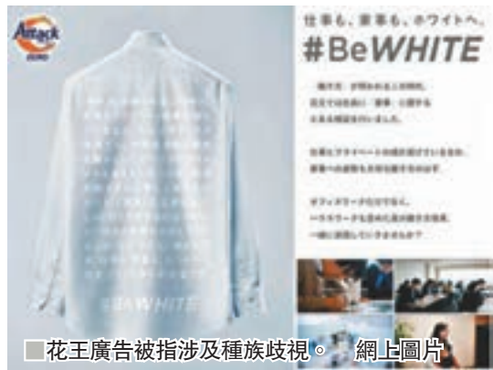
■花王廣告被指涉及種族歧視。網上圖片

日本大型個人護理用品生產商花王，周二推出名為「變白」(#beWHITE)的宣傳活動，除了推廣新款清潔劑外，亦呼籲家庭裡所有成員共同分擔家務。不過該活動隨即引起爭議，有網民質疑涉及種族歧視。花王承認對「變白」的含意敏感度不