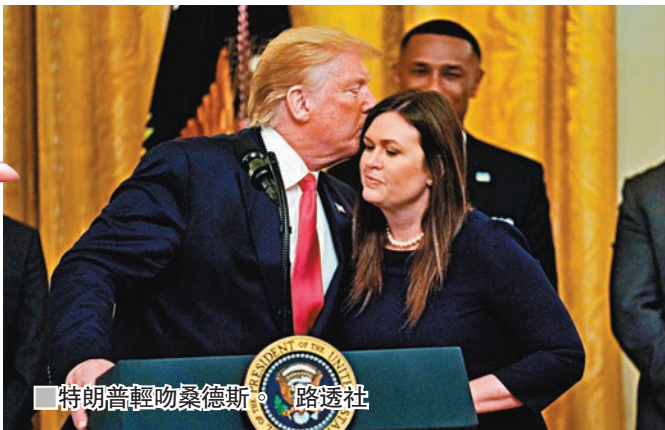
■特朗普輕吻桑德斯。