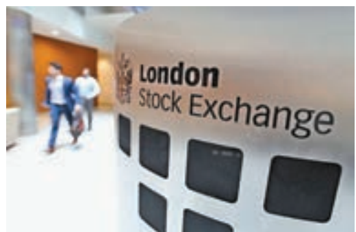
有消息指滬倫通有望下周宣佈啓動。圖為倫敦證交所。

中原證券分析，預計近期滬指繼續圍繞2,900點小幅整理的概率較大，不過充分的蓄勢有望推升下半年可能展開的反彈高度，建議投資者近期繼續關注政策面，資金面以及外部因素的變化情況。 近期滬倫通進展不斷，尤其是西向業務已經蓄勢待發。《21世紀經濟報導》引述權威人士稱，下周一(6月17日)中英兩國將在倫敦開啟第十次中英經濟財金對話，料滬倫通或在這次對話期間宣佈正式啟動，華泰證券將拔得滬倫通頭籌。據稱，目前來看，滬倫通西向業務籌備較東向更積極，例如華泰證券馬上就將發行GDR，但英方尚未有一家企業有發佈CDR的進展。