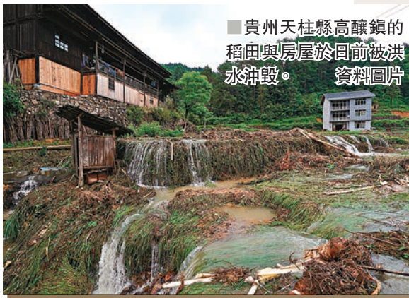
貴州天柱縣高釀鎮的稻田與房屋於日前被洪水沖毀。資料圖片

據國家減災網消息，「東方祥雲」可大幅減少災害損失。國家減災網將過去兩年全國的「洪水場次」、「死亡人數」和「經濟損失」三項主要指標列為簡明表格，顯示「東方祥雲」兩年合計報出率分別為81.5%、88.7%和96.9%，可見其報出率已在較高區間。這意味着，只要根據「東方祥雲」的預警提前做好應對，未來可大幅減少洪水中的人員傷亡及損失。