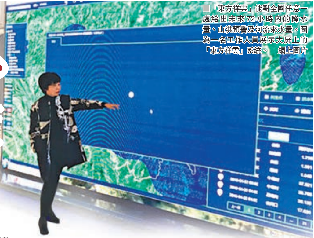
「東方祥雲」能對全國任意一處給出未來72小時內的降水量、山洪預警及河流來水量。圖為一名工作人員展示大廳上的「東方祥雲」系統。網上圖片

最高獎——「雲端大獎」，吸引了眾多天使基金、投資人與「東方祥雲」牽手合作。 緊接着，「東方祥雲」在國家及貴州發展大數據政策的支持下，憑借一批十幾年培養起來的水利、氣象及大數據等複合型人才，結合公司專業的洪水預報、降水預報模型和大數據、雲計算應用能力和擁有精細化氣象數據、全球GIS數據、多年累積的水利數據等內容，逐漸成長為專業從事水利信息化建設，專業從事防洪減災服務的大數據公司，並取得行業領先地位，為全國乃至全球水庫、水電站提供預警預報服務。 今年3月31日，該公司為國家應急管理部量身打造的防汛抗旱監測預警系統上線試運行。截至目前，基於「東方祥雲」的各種應用已在貴州、廣西、甘肅等地落地。 目前，「東方祥雲」將全國劃分為19個區域，有670萬個計算節點。如有需要，可以對全球大部分區域的流域進行「偵測」。其聚焦的範圍甚至可以精準到2平方公里。