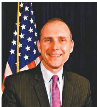
史墨客將出任美駐港澳總領事。

美國駐港澳總領事館昨日發出的公告表示,美國國務卿蓬佩奧已委任史墨客為下一任美國駐港澳總領事。史墨客獲委任前是高級職業外交官,在國務院出任主管中國事務處的副助理國務卿。史墨客曾經出任美國駐上海總領事,美國國務院中國及蒙古事務處處長,也曾經在多