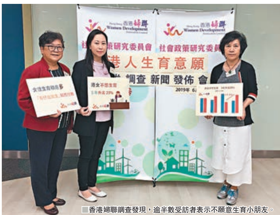
香港婦聯調查發現,逾半數受訪者表示不願意生育小朋友。

建議增建公營房屋,為育有子女的家庭優先輪候公屋或居屋,改善年輕夫婦的居住生活質素,締造有利生育的環境,並向首次置業市民提供免息或低息置業貸款,提升年輕人對未來的希望。